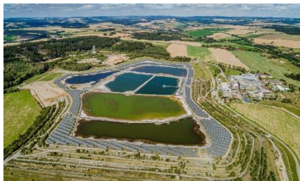
Fotovoltaická elektrárna Rožná