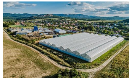
Biomasová teplárna Krnčič

Elektrárna v Rožně využívá prostoru, který žádné jiné využití nemá. Nezabírá prostor klasické produkci potravin, nehydž krajinu. Tato oblast byla navíc vyhodnocena jako riziková. Úzký pás okolo odkaliště odpadů poblíž uranového dolu je tak ideálním místem, kde postavit solární panely. Nikomu zde nevdá a je k nim velice snadný přístup. Instalace panelů navíc pomáhá vyrovnat ekologickou zátěž daného místa.