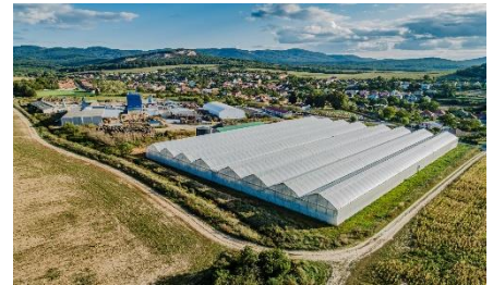
Biomasová teplárna Krnčá

Elektrárna v Rožně využívá prostoru, který žádné jiné využití nemá. Nezabírá prostor klasické produkci potravin, nehydž krajinu. Tato oblast byla navíc vyhodnocena jako riziková. Úzký pás okolo odkaliště odpadů poblíž uranového dolu je tak ideálním místem, kde postavit solární panely. Nikomu zde nevádí a je k nim velice snadný přístup. Instalace panelů navíc pomáhá vyrovnat ekologickou zátěž daného místa.